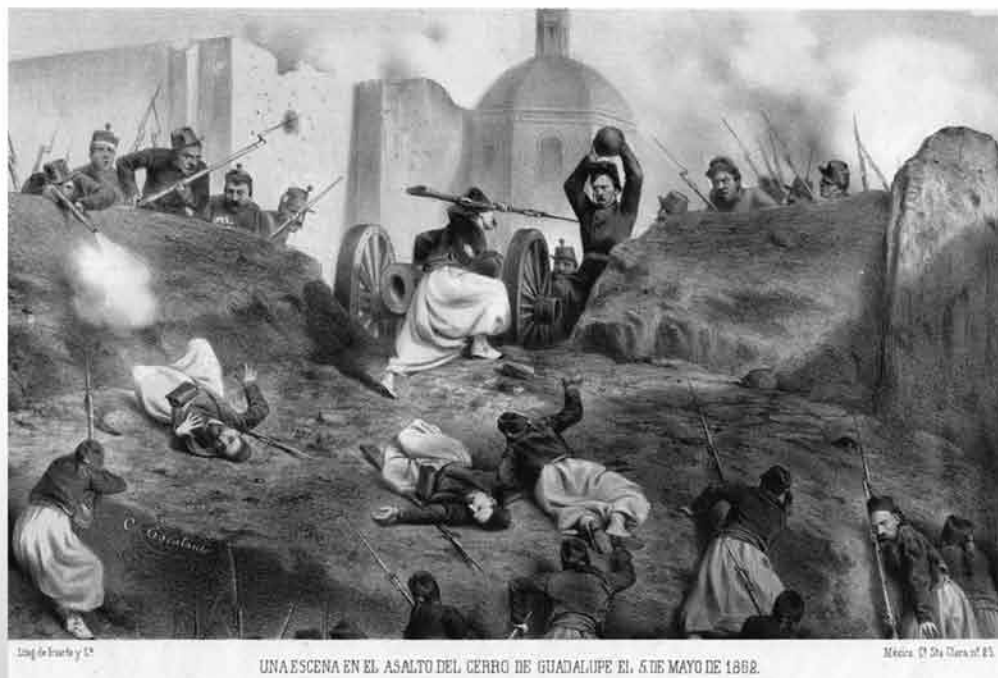
UNA ESCENA EN EL ASALTO DEL CERRO DE GUADALUPE EL 5 DE MAYO DE 1862.