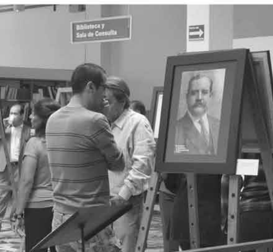
La Benemérita Academia de Profesores del Glorioso Colegio del Estado.

Finalmente invitó a todos los interesados en el estudio histórico y actual de la Máxima Casa de Estudios en la entidad, a introducirse en el vasto mundo de documentos que conforman el Archivo Histórico Universitario.