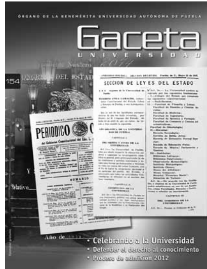
Portada: Ley de la Universidad de Puebla, publicada en el Periódico Oficial del Estado. Archivo Histórico Universitario.